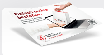
Aufkleber A4 Quer- und A3 Hochformat