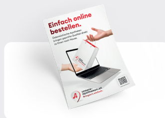
Plakat A4 u. A3