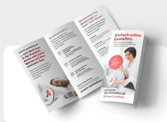
Folder Wickelfalz 6-seitig